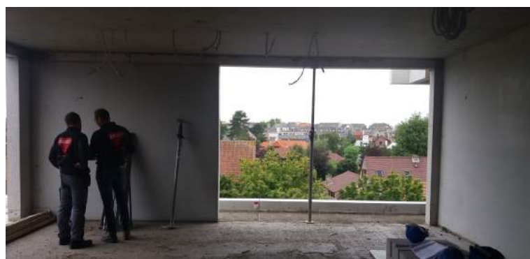
Assistentiewoning 1ste verdieping