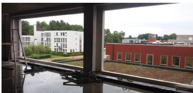
Gemeenschappelijke ruimte 2de verdieping

Het bouwverlof zit erop. Wat wil zeggen dat de werken van Doornhuys terug van start zijn gegaan en dat zullen we geweten hebben ook! De pilaren van de flats zijn verdwenen in een sneltempo en dat zorgt voor een meer ruimtelijk gevoel als je in het gebouw rondloopt. Beetje bij beetje krijgt alles vorm, fijn om deze evolutie van zo dichtbij te kunnen meemaken. Ook jullie kunnen dit alles nog steeds volgen via www.doornhuys.be