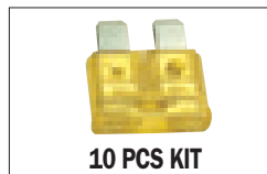
10 PCS KIT

15A □ 802256 Alpine 30 Boost 20A □ 802257 Alpine 20 Boost