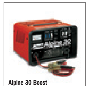
Alpine 30 Boost