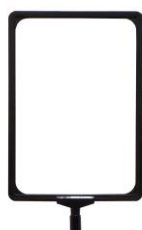
RSA4PN (en option)