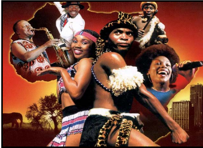
[Uit: Gauteng , Desember 2007]