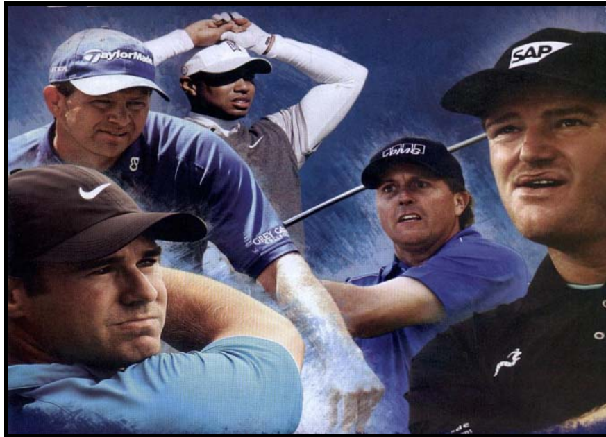
[Uit: DSTV-gids, Mei 2008]