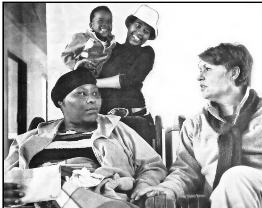
[Uit: Beeld , 14 Julie 2009]