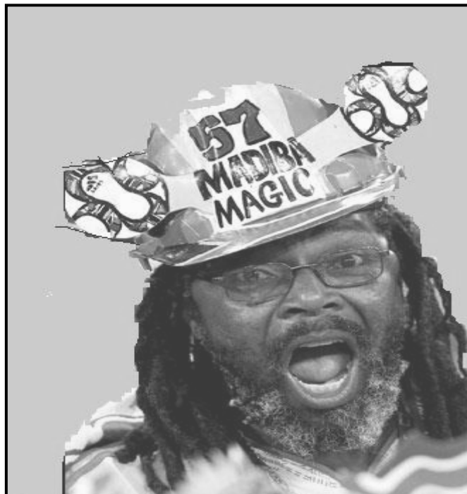
[Uit: Art Explosion 300,00 Image Collection , 7 April 2010]