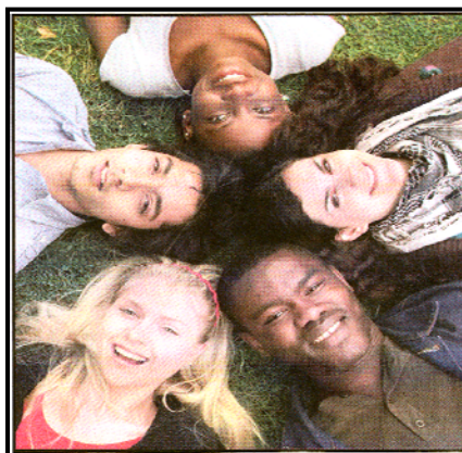
[ISOLEZWE, 8 Februarie 2010]

SITUASIE: John, Susan, Steve, Mpho en Marie voltooi hierdie jaar matriek. Hulle is BLY en gesels oor hoe DANKBAAR hulle is om mekaar as vriende te hê.