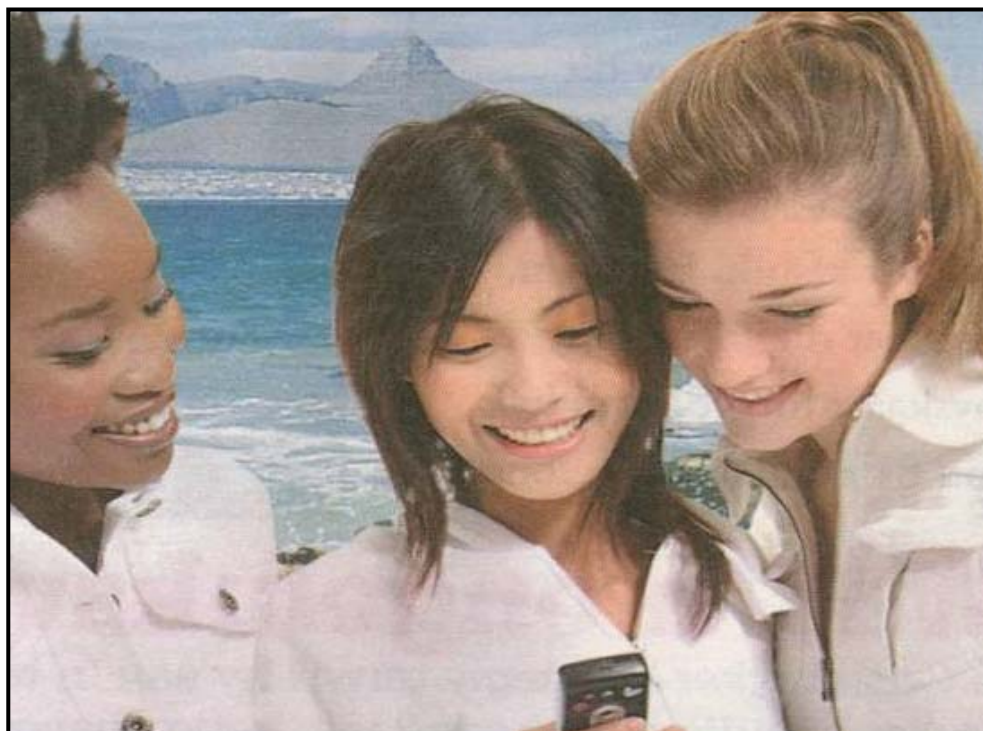
[Uit: Huisgenoot , November 2006]