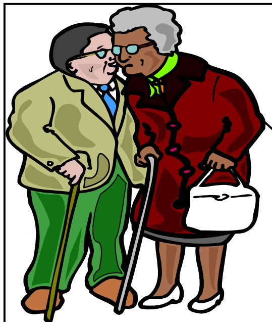
[Uit: Clipart ]