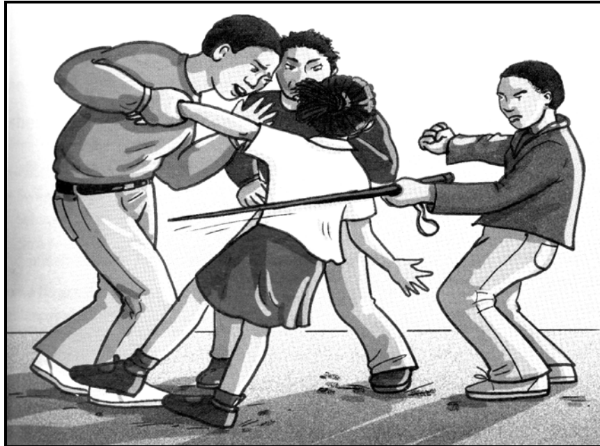
[Setshwantsho se qotsitswe bukeng ya Sesotho Puo ya Lapeng , RR Mokolopo le ba bang: 2012:57]