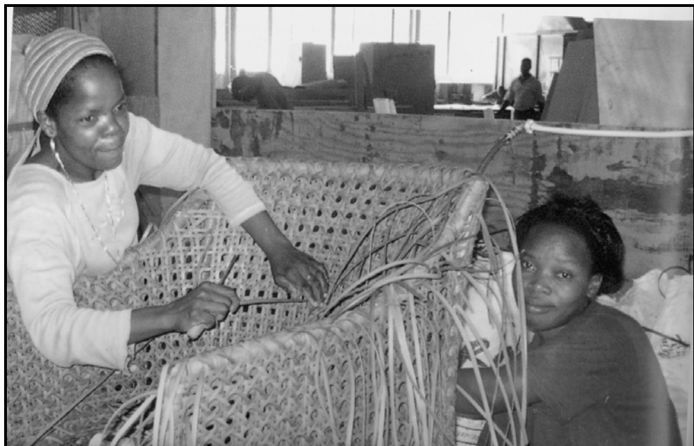
[Se qotsitswe makasineng wa Abucus : Phato 2009: 99]