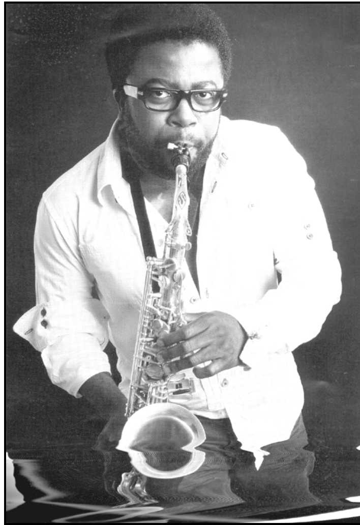
[Se qotsitswe makasineng wa Abucus : Phato 2009: 209]