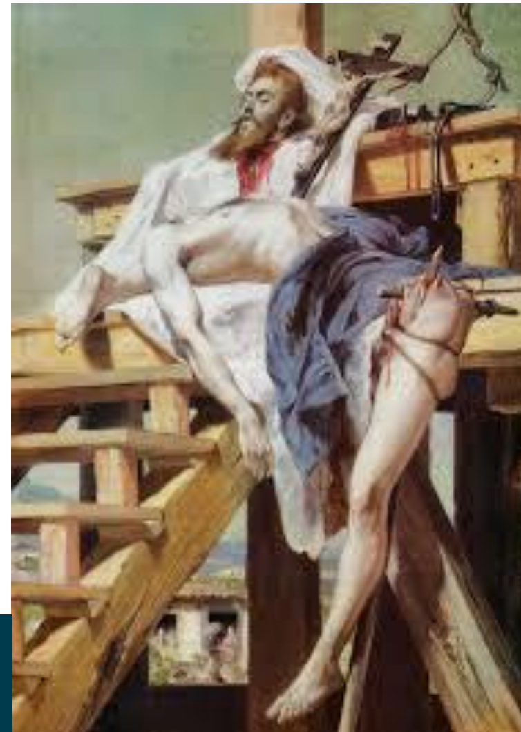
Tiradentes Esquartejado Pedro Américo