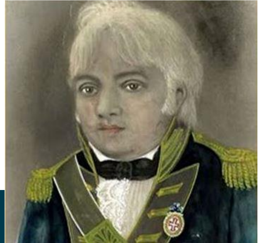
Joaquim Silvério dos Reis