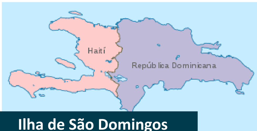
Ilha de São Domingos