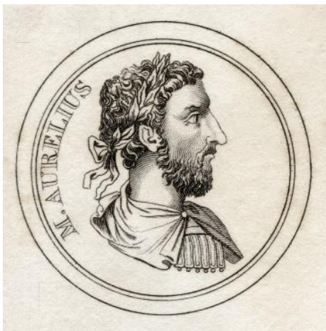
M. Aurélio 161-180