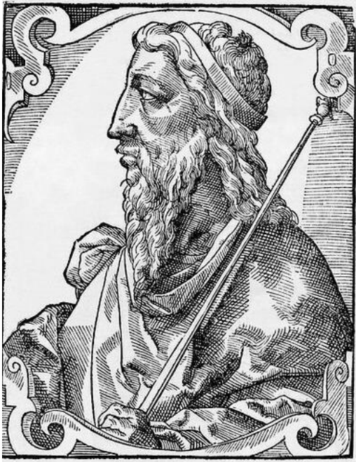
Rômulo Augusto 460-476