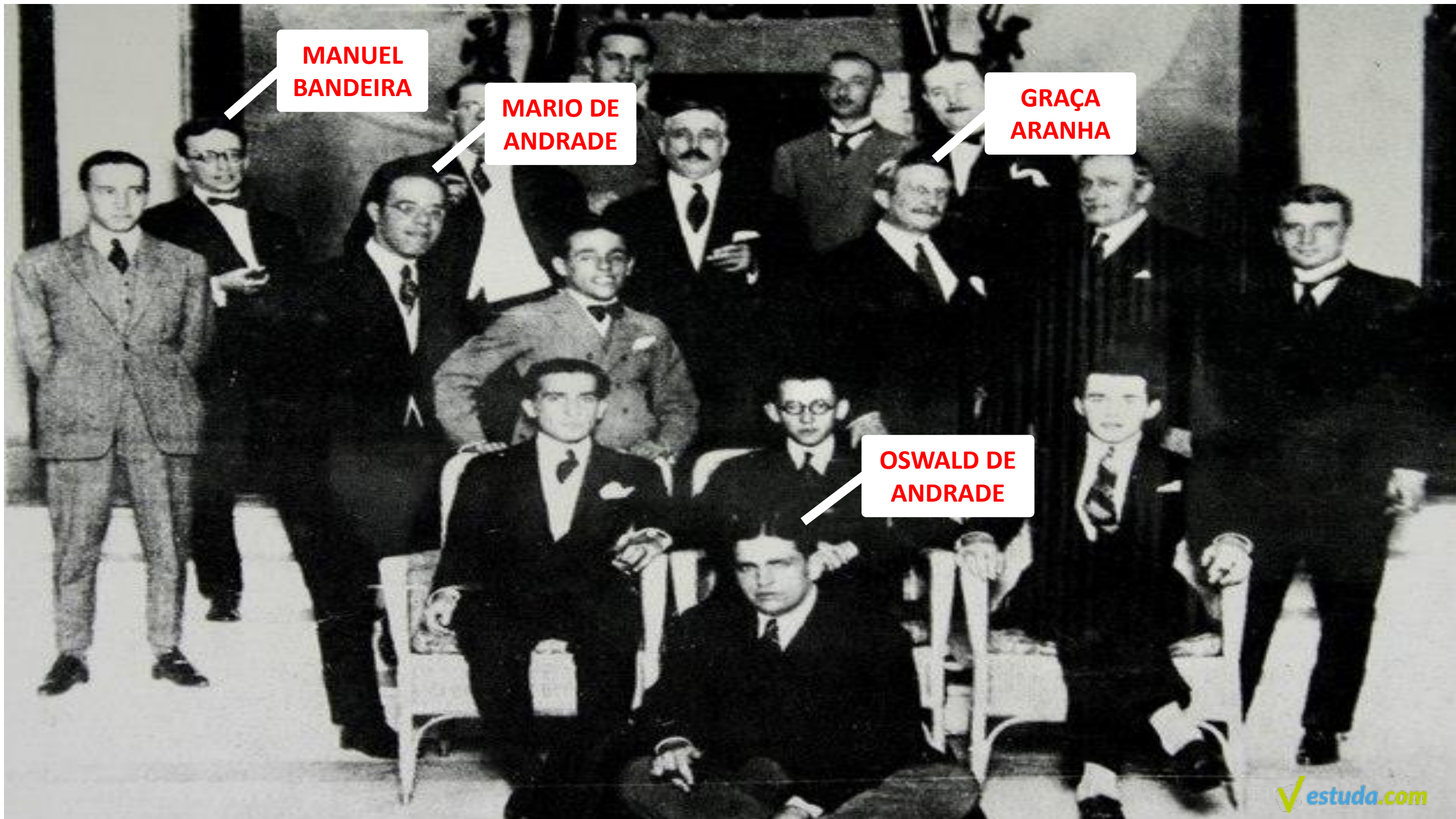
OSWALD DE ANDRADE