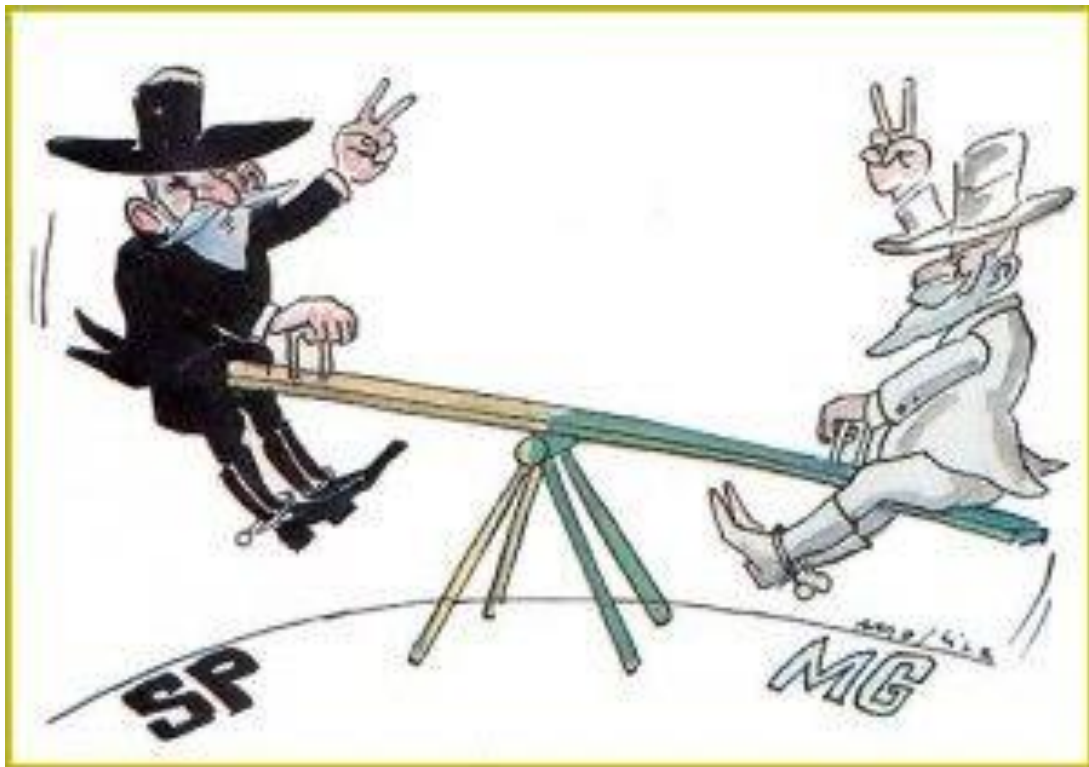
POLÍTICA DO CAFÉ-COM-LEITE