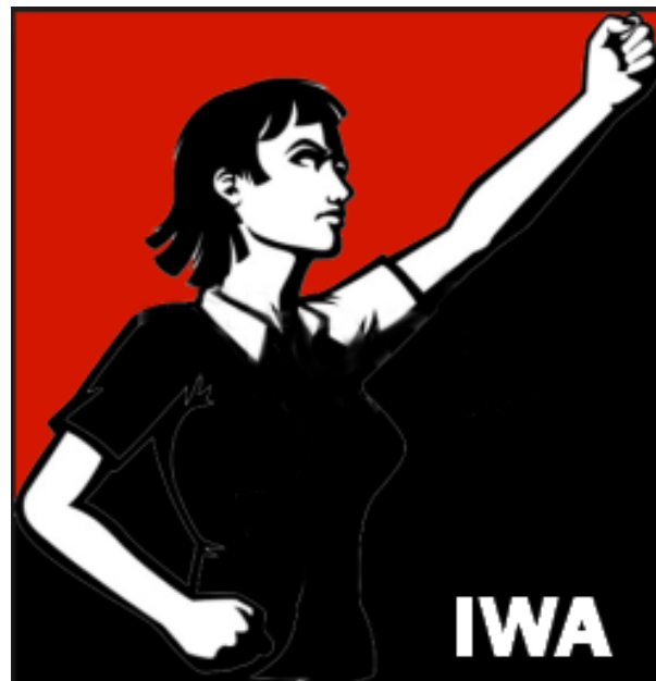
ANARQUISTA E SINDICALISTA, ESSE MOVIMENTO OCORREU EM SP