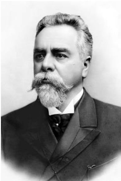
Presidente Campos Sales