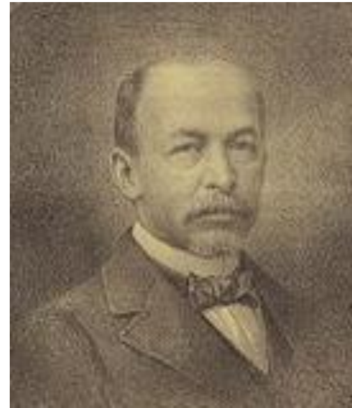
Ministro Joaquim Murinho