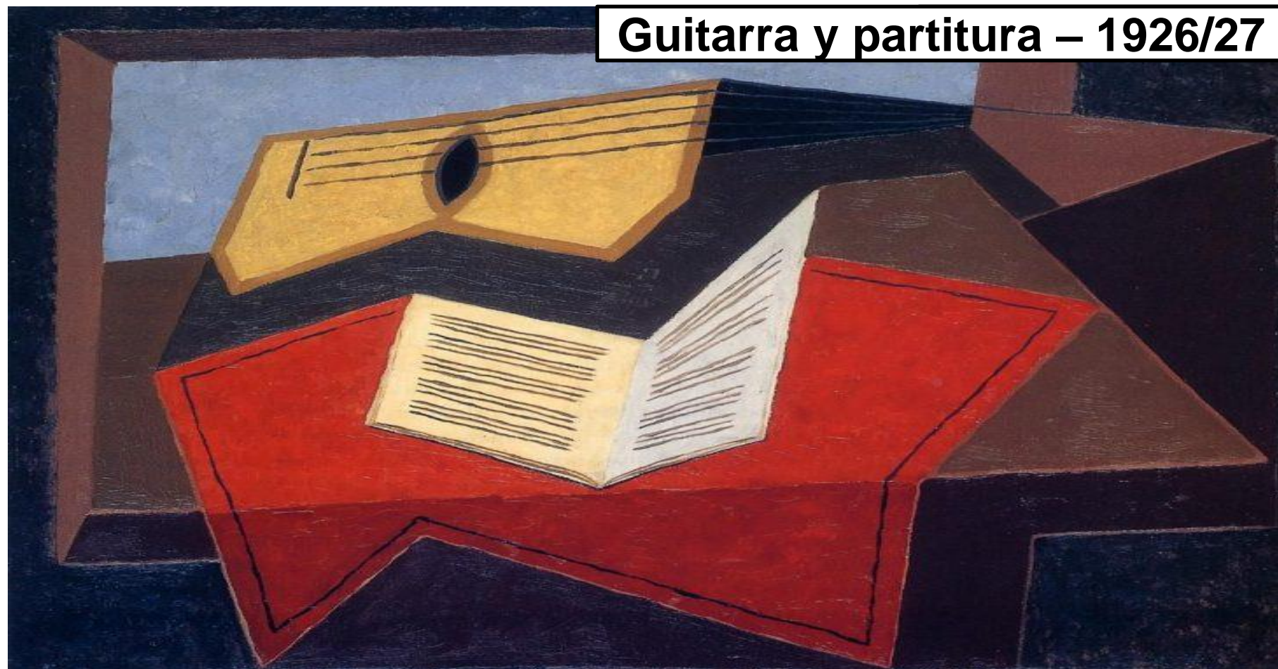
Guitarra y partitura – 1926/27