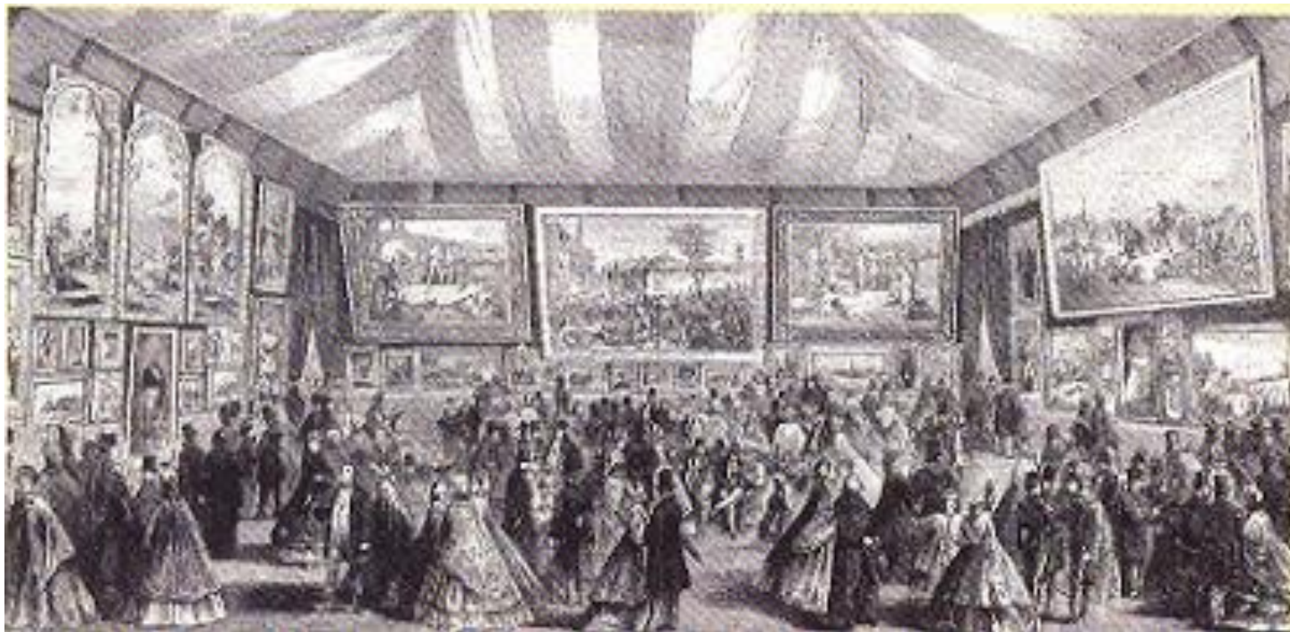
Salão dos Independentes de Paris - 1906