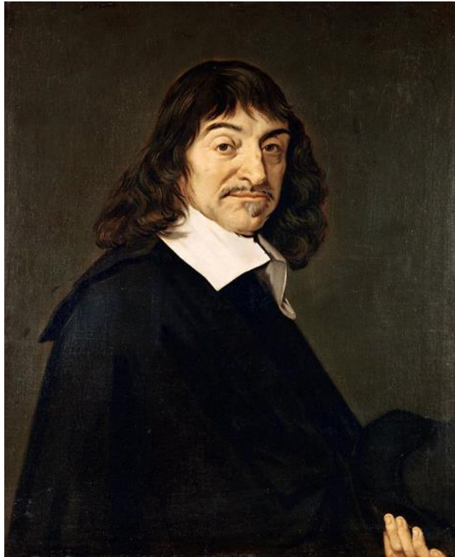
René Descartes (1596-1650)

→ Filosofia e fatores científicos modernos envolvidos