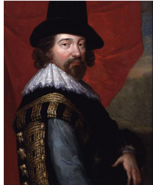
Francis Bacon (1561-1626)