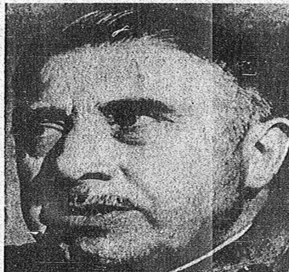
Santiago de Chile. — General Augusto Pinochet, comandante en jefe del ejército chileno. —.

Los dos profesionales fueron conducidos por soldados hasta el segundo piso de ese Palacio, prácticamente destruido por la explosión.