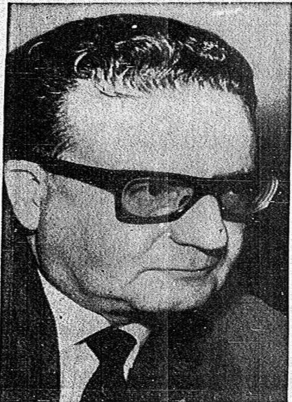
(Reportaje en página B-Ultima)