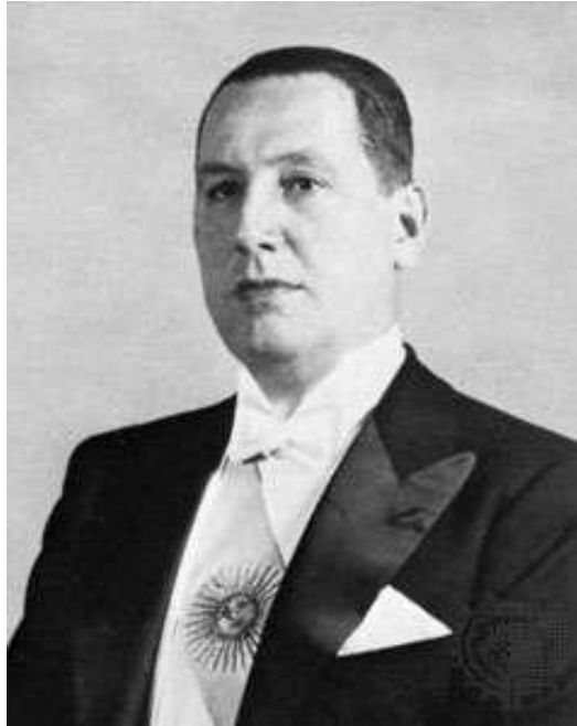
JUAN D. PERON