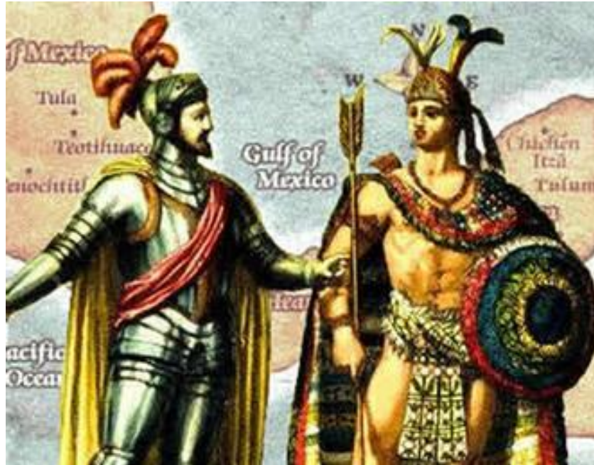
Cortez e Montezuma II