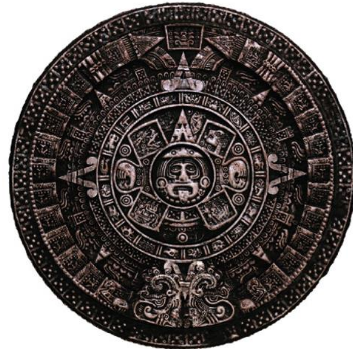
Pedra do Sol