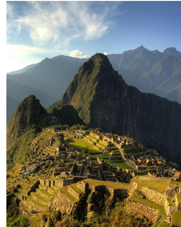
MACHU PICCHU: Encontrada apenas em 1911