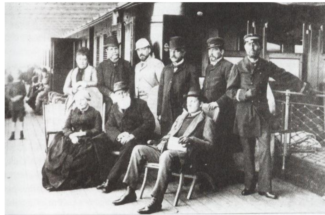
Família Real Banida em 1889