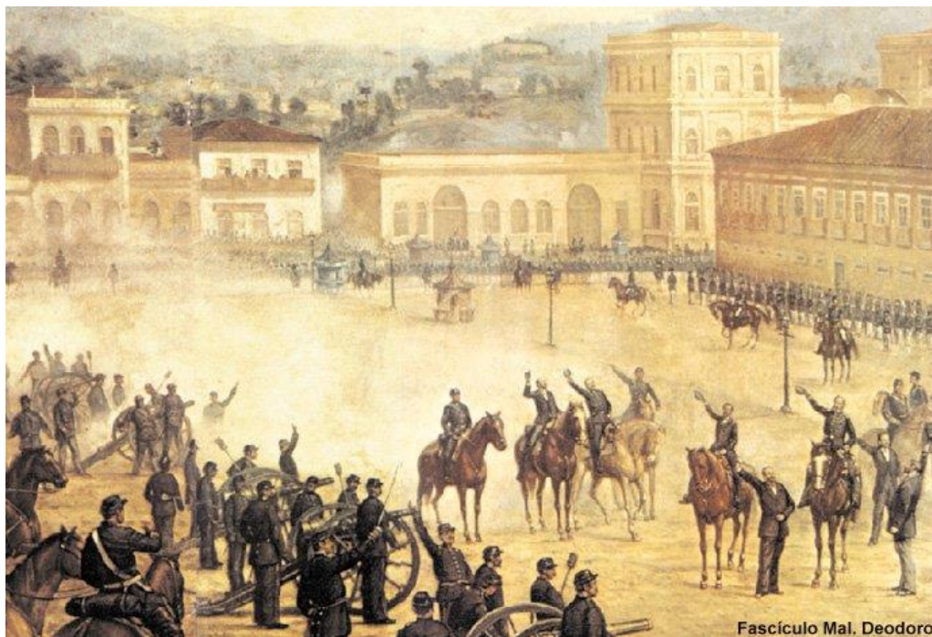
Proclamação da República