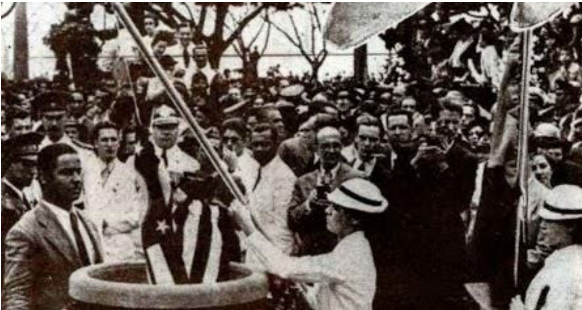
Cerimônia de queima das bandeiras estaduais