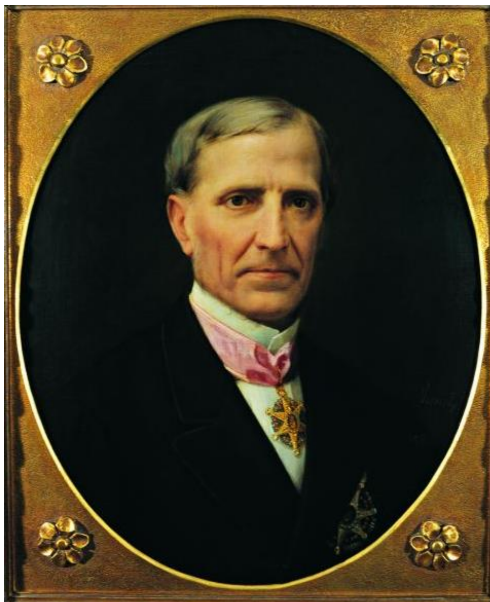
BARÃO DE MAUÁ