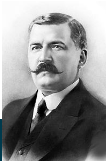
Presidente Venceslau Brás