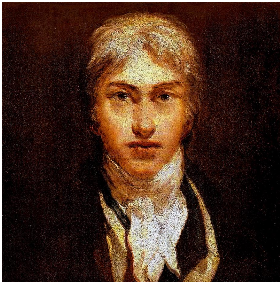
Joseph Mallord William Turner