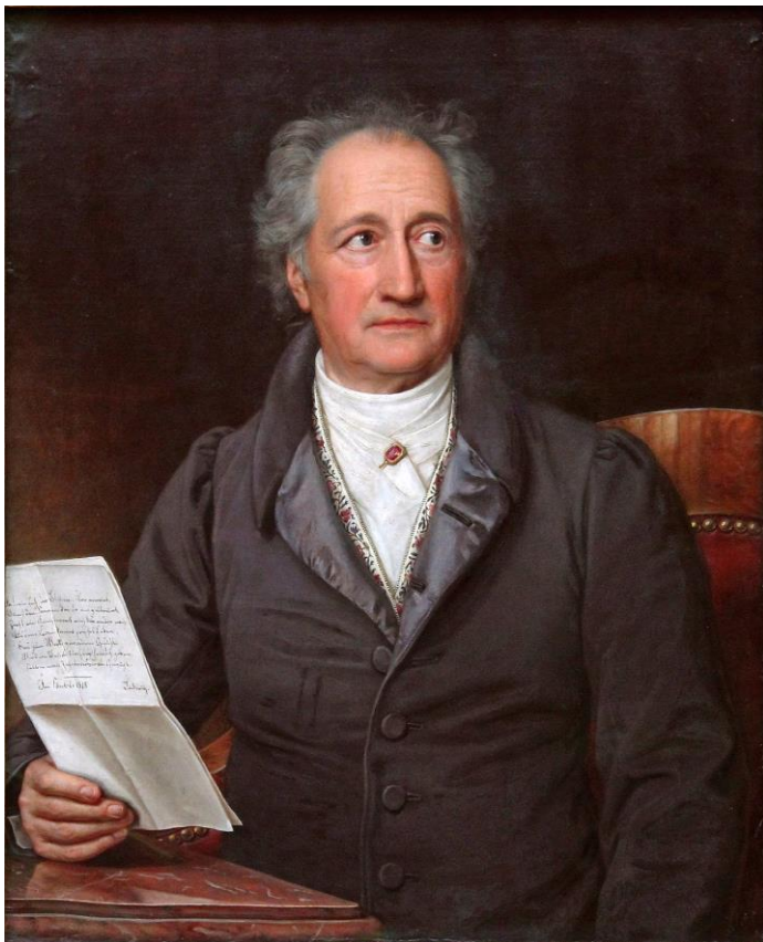
Johann Wolfgang von Goethe