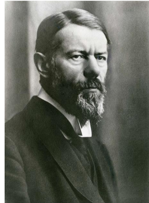
Max Weber (1864-1920)