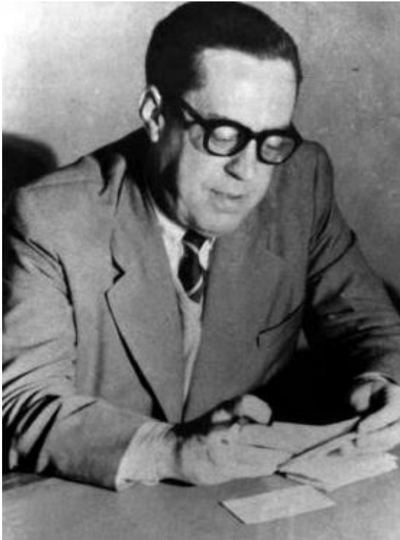
Sergio Buarque de Hollanda (1902-1982)

➔ 1927: Sergio Buarque de Hollanda vai à Alemanha como jornalista e entra em contato com a teoria de Max Weber