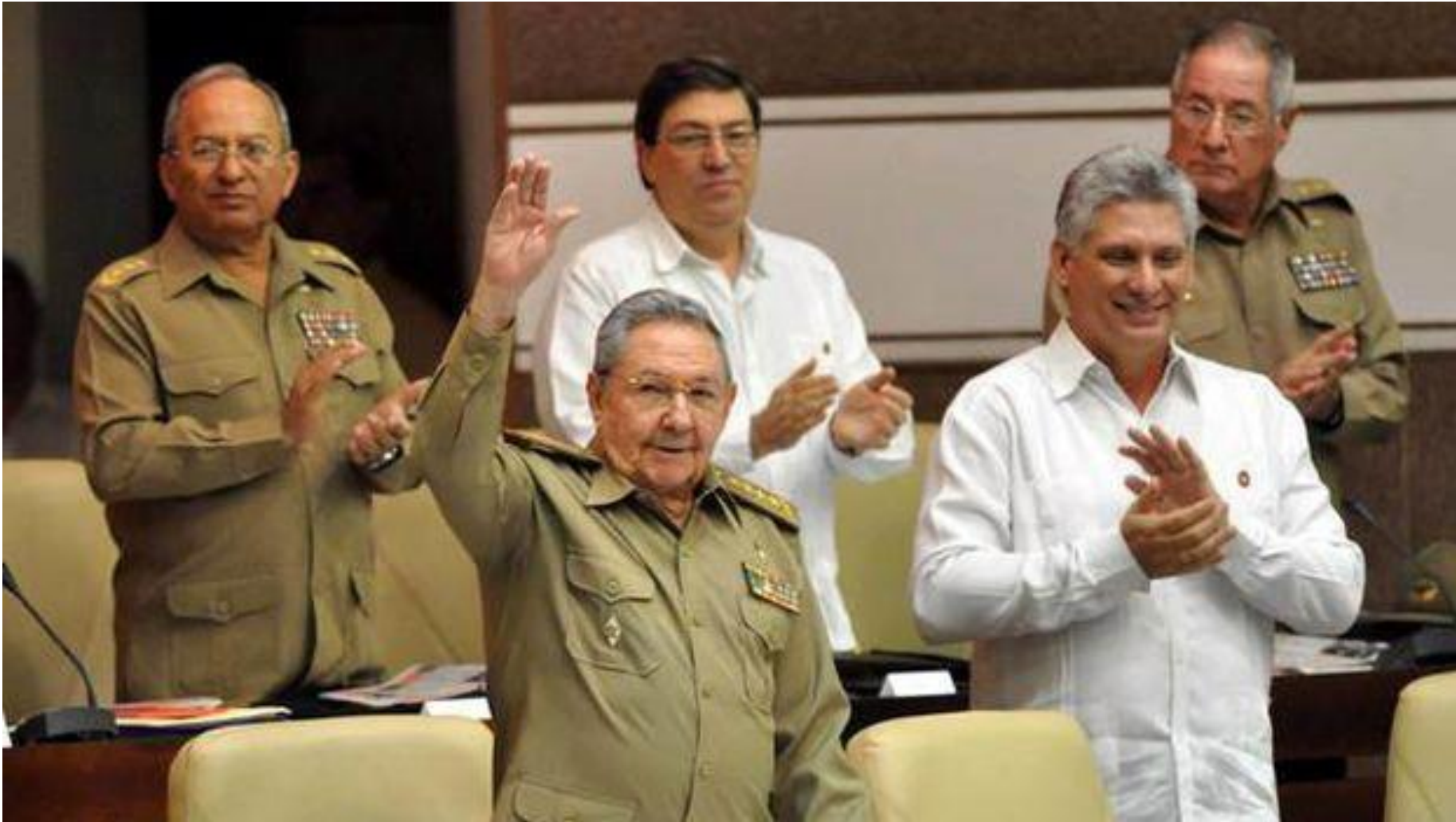
Miguel Díaz-Canel ( El hombre )