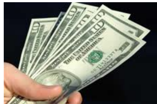
FINANCEIRO O 1945...