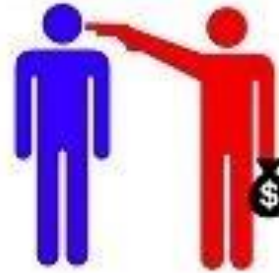
capitalismo (descrito por socialistas)