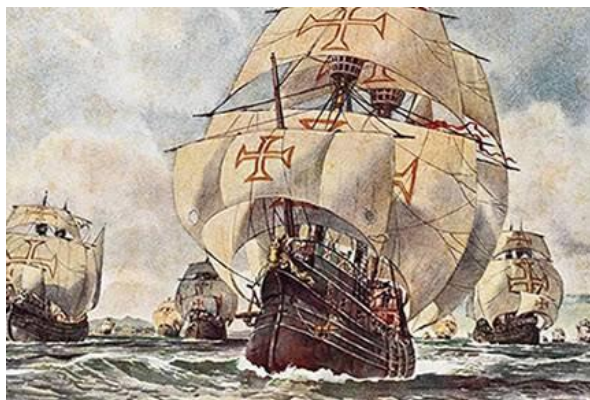
COMERCIAL L Séc.XVI...