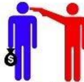
socialismo (descrito por capitalistas)

https://afolhatorres.com.br/colunas/comunismo-ou-capitalismo/