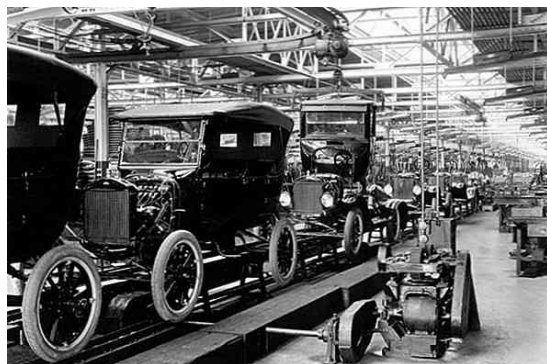
INDUSTRIAL L 1780...