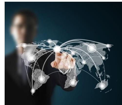
GLOBALIZAÇÃO DO 1990..