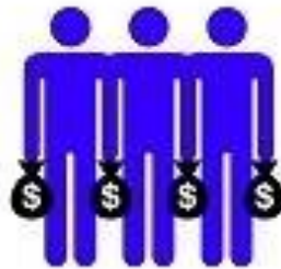
socialismo (descrito por socialistas)