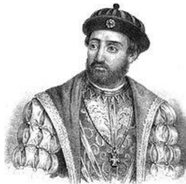
MARTIM AFOINHO DE SOUZA.

1ª expedição colonizadora: SÃO VICENTE - 1532