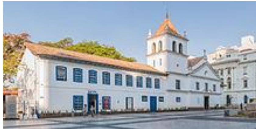
São Paulo de Piratininga - 1554