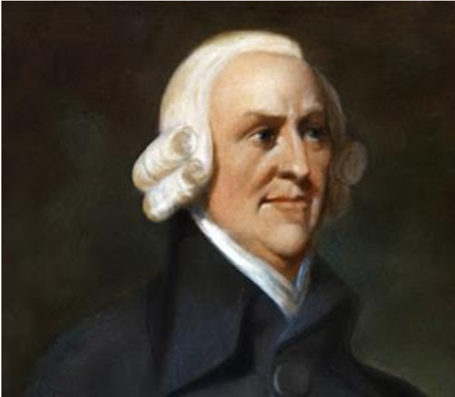
Adam Smith (1723-1790)