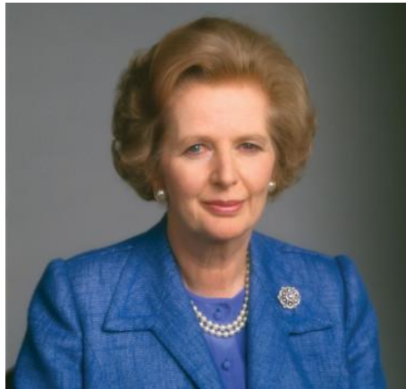
Margaret Thatcher (1925-2013)