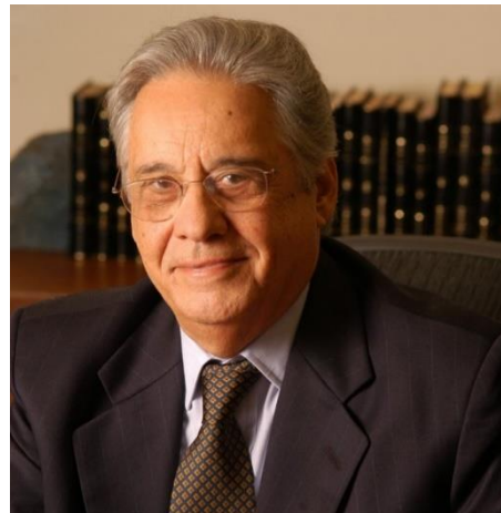
Fernando H. Cardoso (1931-...)