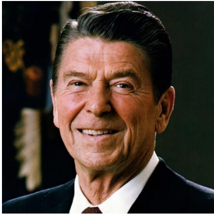
Ronald Reagan (1911-2004)