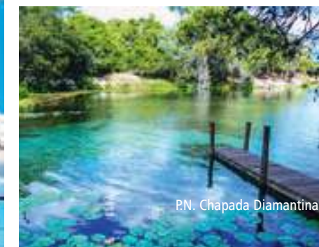
P.N. Chapada Diamantina

z głównych ośrodków wydobywania diamentów. Dziś znajdują się tu w większości ruiny ukazujące historię miasta i okolicy. Powrót do hotelu, nocleg.