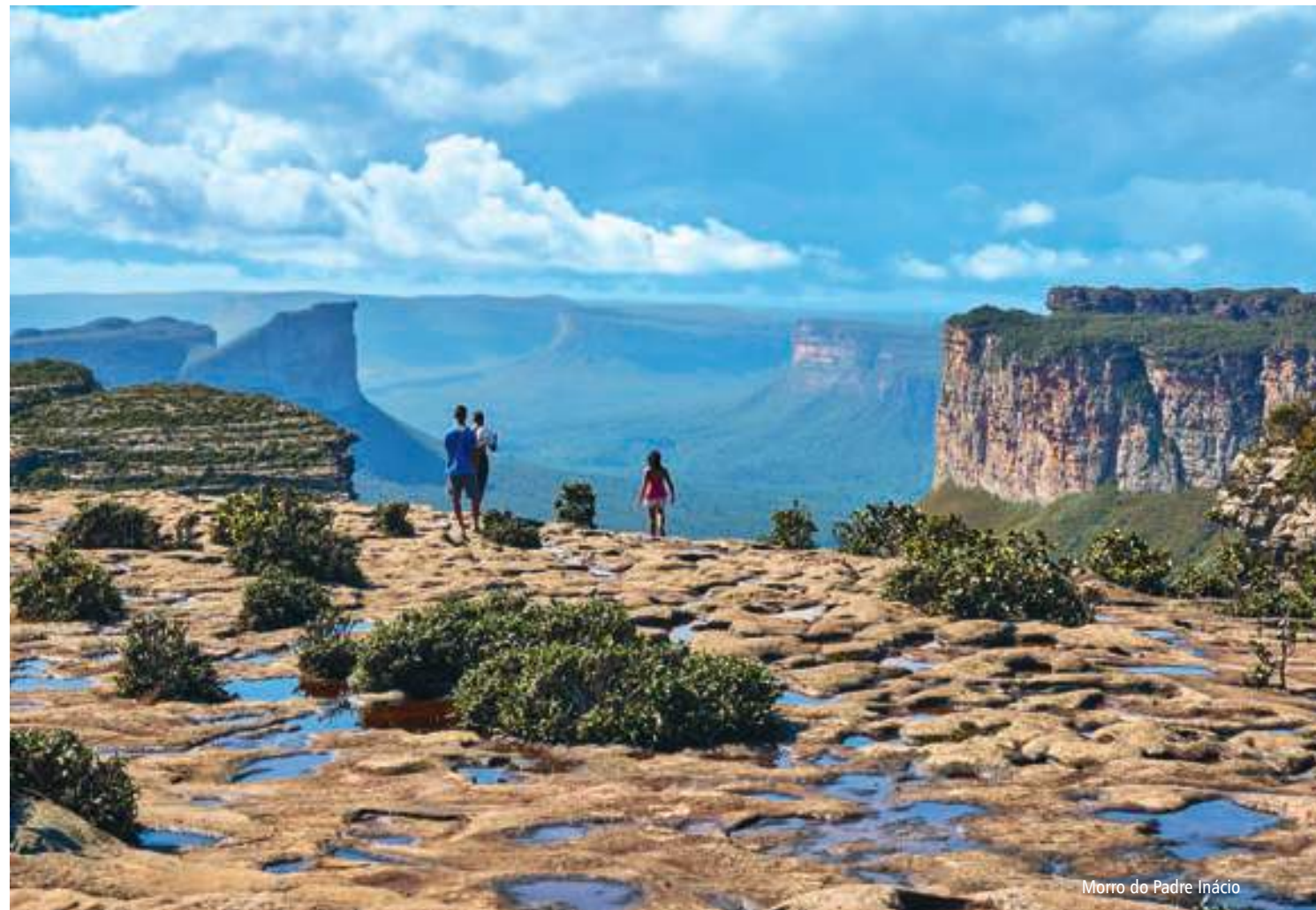
Morro do Padre Inácio

» GRUTA DA PRATINHA » GRUTA AZUL » GRUTA DA LAPA DOCE » MORRO DO PADRE INÁCIO » POÇO ENCANTADO » POÇO AZUL » IGATU » SALVADOR