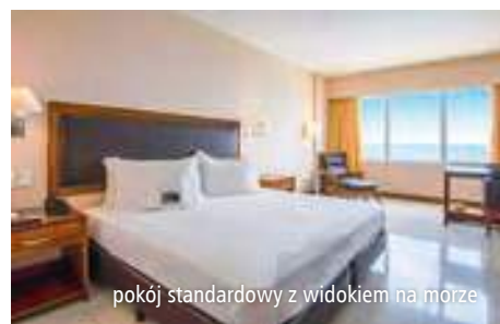
pokój standardowy z widokiem na morze

Spędź urlop w tętniącym życiu i pełnym lokalnego kolorytu Salvadorze! Proponujemy hotel w pierwszej linii brzegowej, blisko piaszczystej plaży oblewanej wodami Atlantyku – idealnym miejscu na wakacje w gorącym, brazylijskim słońcu. Doskonała lokalizacja i wyjątkowa sceneria sprawiają, że na własnej skórze można tu poczuć klimat miasta, którego życie płynie w rytmie samby. Główną atrakcją hotelu stanowi taras z basenem, który oprócz ochłody zapewnia zapierające dech widoki na bezkres oceanu. Do dyspozycji Gości są 2 restauracje serwujące wyśmienite potrawy kuchni lokalnej i włoskiej, które trafią w gusta najbardziej wymagających smakoszy. Na relaks i chwilę oddechu po całodziennych aktywnościach polecają się 2 klimatyczne bary słynące z pysznych i orzeźwiających drinków, a wyższy poziom relaksu zapewnią masaże i zabiegi pielęgnacyjne, które oferuje centrum wellness. W okolicy znajduje się wiele ciekawych atrakcji, w tym Muzeum Sztuki Nowoczesnej Bahia i barwna dzielnica Pelourinho. Koniecznie wybierz się również na długi spacer po urokliwych zakątkach miasta, a wieczorami oglądaj cudowne i romantyczne zachody słońca!