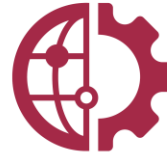
Technologie, logiciels et interfaces