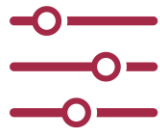
Processus et organisation