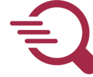
Formation et recherche