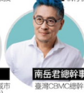
南岳君總幹事 臺灣CBMC總幹事