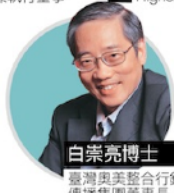
白崇亮博士 臺灣奧美整合行銷 傳播集團董事長