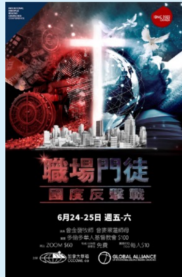
《職場門徒：國度反擊戰》 銳意門訓教會大會2022 (英/粵)