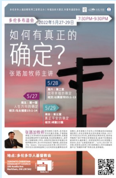
《如何有真正的確定?》 多倫多佈道會 (國)