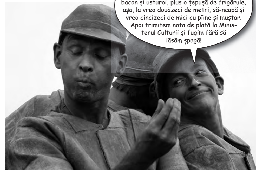
Grup statuar reprezentînd niște muncitori români împietriți de durere, care, din cauză că au rămas fără casă și serviciu, au decis să se mute pe un soclu, în Piața Mare.