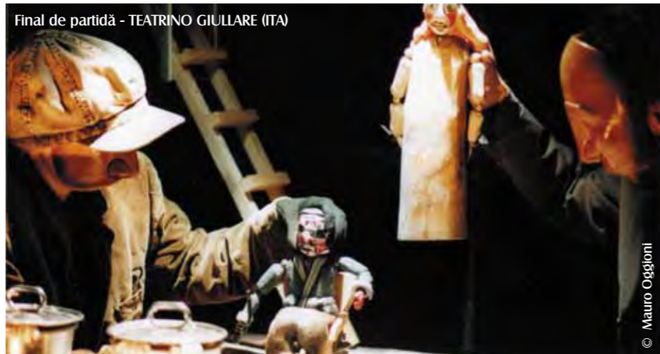
Final de partidă - TEATRINO GIULLARE (ITA)