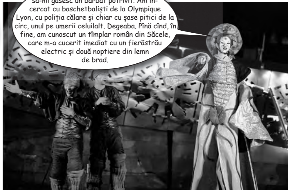
Ansamblu de artiști francezi care s-au obișnuit să trăiască pe picioroange pentru că acolo, sus, aerul e mai curat și îi vezi de departe pe emigranții români care vin să-ți fure portofelul cu lanseta.

Cel mai greu în viață a fost să-mi găsesc un bărbat potrivit. Am încercat cu baschetbaliști de la Olympique Lyon, cu poliția călare și chiar cu șase pitici de la circ, unul pe umerii celuilalt. Degeaba. Pînă cînd, în fine, am cunoscut un tîmplar român din Săcele, care m-a cucerit imediat cu un fierăstrău electric și două noptiere din lemn de brad.