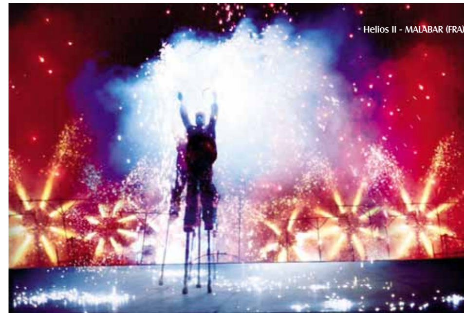
Helios II - MALABAR (FRA)