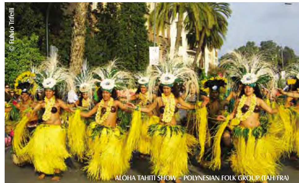
ALOHA TAHITI SHOW – POLYNESIAN FOLK GROUP (TAH/FRA)

În perioada 27mai – 05 iunie vor fi prezentate publicului peste trei sute de evenimente, la care vor participa actori și companii din șaptezeci de țări, tocmai acesta fiind prilejul de a pune punctul pe „i” și de a atrage atenția publicului asupra spiritului unei comunități și asupra importanței și influenței pe care aceasta o are în viața de zi cu zi a fiecărui om care face parte din ea. Festivalul este prilejul pentru a consolida relațiile internaționale și pentru a împlini armonia minorităților comunității sibieni. Tocmai pentru a ajuta la îndeplinirea acestui scop,