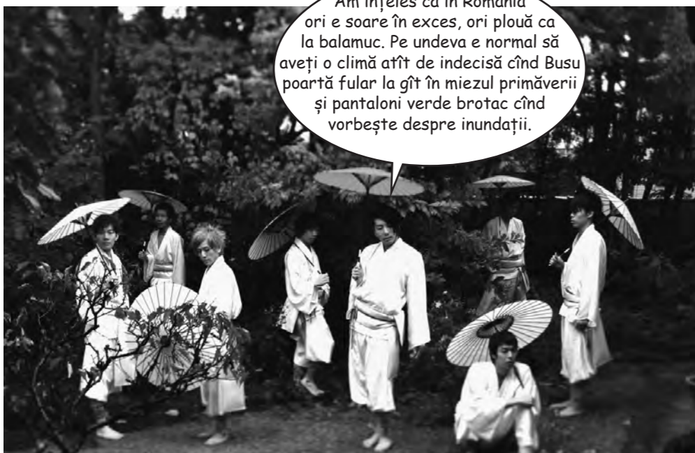
Grup de actori japonezi dotați cu umbrele de ultimă generație, din titan, antrenați să facă față atît precipitațiilor în aversă, sub formă de tsunami, cît și exploziilor solare de la Fukushima.

Am înțeles că în România ori e soare în exces, ori plouă ca la balamuc. Pe undeva e normal să aveți o climă atît de indecisă cînd Busu poartă fular la gît în miezul primăverii și pantaloni verde brodat cînd vorbește despre inundații.