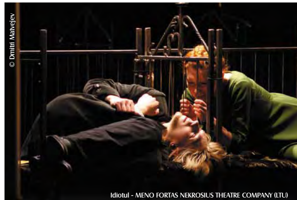
Idiotul - MENO FORTAS NEKROSIUS THEATRE COMPANY (LTU)