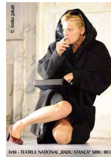
Felii - TEATRUL NAȚIONAL „RADU STANCA” SIBIU (ROU)