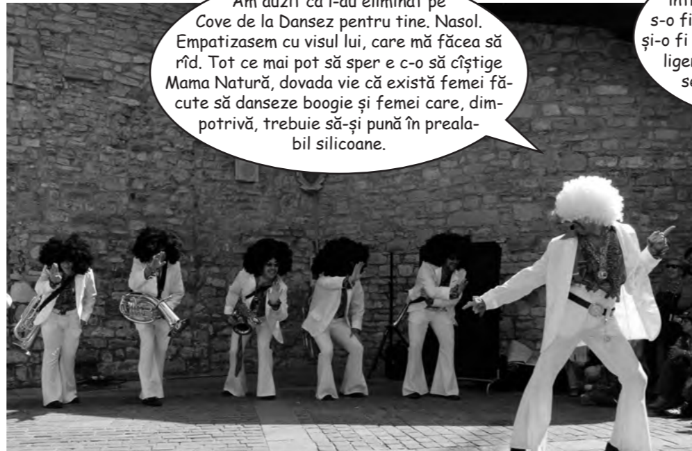
Ansamblu de călușei disco, demonstrînd sibienilor că tradițiile nu pier, ci doar se remixează în club lounge-ul satului.