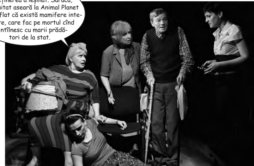
Scenă din spectacolul Faceți loc, în care sperăm că e vorba despre o familie de români care n-are loc într-o garsonieră din Vitan și își cumpără o vilă confort 2 semidecomandată la Berlin.

Cînd i-am zis cît a venit întreținerea a leșinat. Săraca, s-o fi uitat aseară la Animal Planet și-o fi aflat că există mamifere inteligente, care fac pe mortul cînd se-nfîlesc cu mării prădători de la stat.