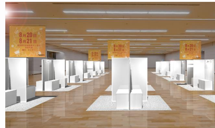
※展示会場内スペシャルバナー(天吊り)イメージ