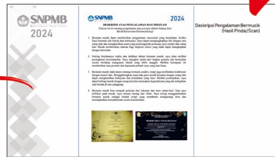
Halaman Tulisan Deskripsi Pengalaman Bermusik (Gunakan Template Dokumen yang disediakan)

Catatan: Template PPT untuk Portofolio Seni Musik dan Etnomusikologi berbeda warna. Peserta dimohon cermat dalam menggunakan template PPT sesuai bidang pilihannya