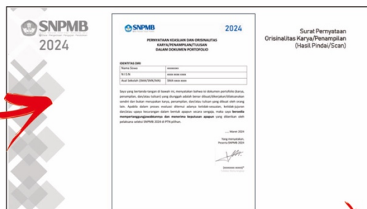
Halaman Pernyataan Orisinalitas (Isi Lengkap + Tandatangani)