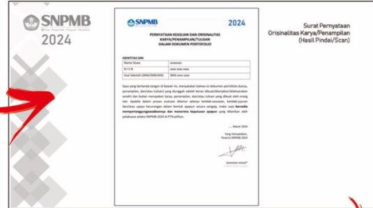
Halaman Pernyataan Orisinalitas (Isi Lengkap + Tandatangani)