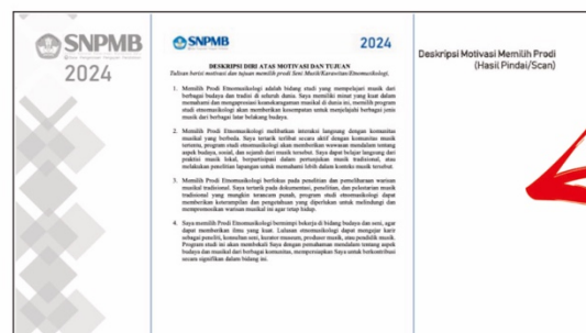
Halaman Tulisan Deskripsi Motivasi Memilih Prodi (Gunakan Template Dokumen yang disediakan)