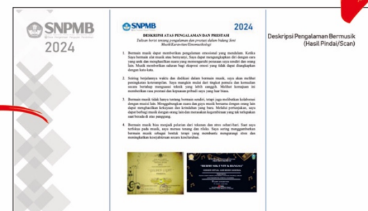
Halaman Tulisan Deskripsi Pengalaman Bermusik (Gunakan Template Dokumen yang disediakan)

Catatan: Template PPT untuk Portofolio Seni Musik dan Etnomusikologi berbeda warna. Peserta dimohon cermat dalam menggunakan template PPT sesuai bidang pilihannya