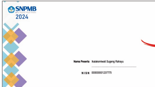
Halaman Cover (Isikan Nama + NISN)