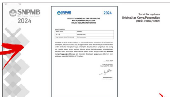
Halaman Pernyataan Orisinalitas (Isi Lengkap + Tandatangani)