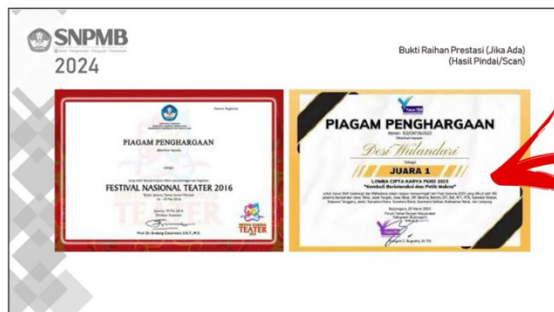
Halaman Bukti Raihan Prestasi dalam Bidang Seni (jika ada)