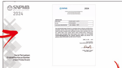
Halaman Pernyataan Orisinalitas (Isi Lengkap + Tandatangani)