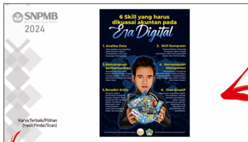
Halaman Karya Terbaik /Pilihan (Sesuai bidang Seni Rupa, Desain, Kriya)