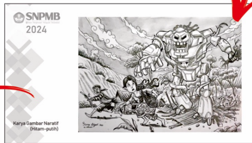
Halaman Gambar Naratif (Sesuai Tema/Petunjuk Soal)