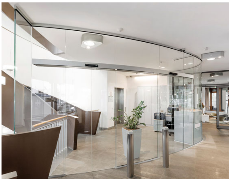
Sonderabmessungen und Glaskombinationen nach Ihren Wünschen