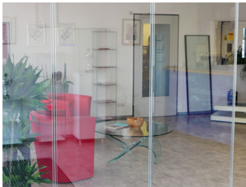
Höchste Ansprüche bezüglich Schallschutz