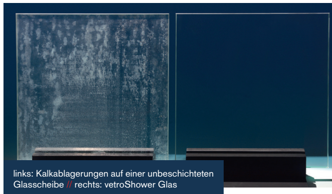
links: Kalkablagerungen auf einer unbeschichteten Glasscheibe // rechts: vetroShower Glas