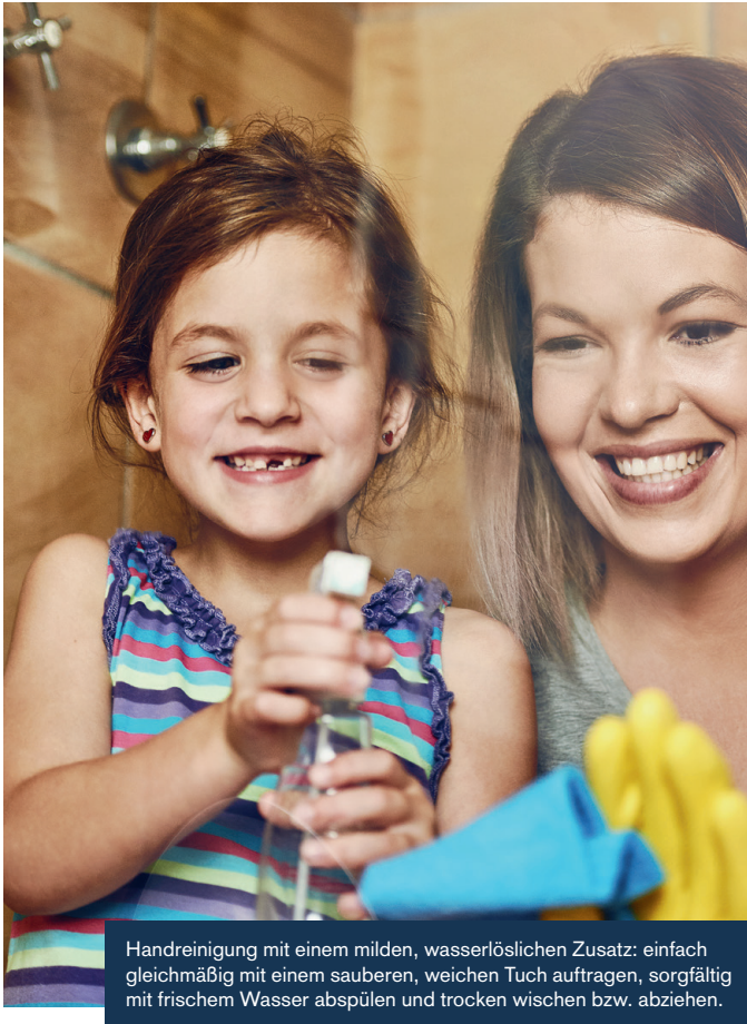
Handreinigung mit einem milden, wasserlöslichen Zusatz: einfach gleichmäßig mit einem sauberen, weichen Tuch auftragen, sorgfältig mit frischem Wasser abspülen und trocken wischen bzw. abziehen.