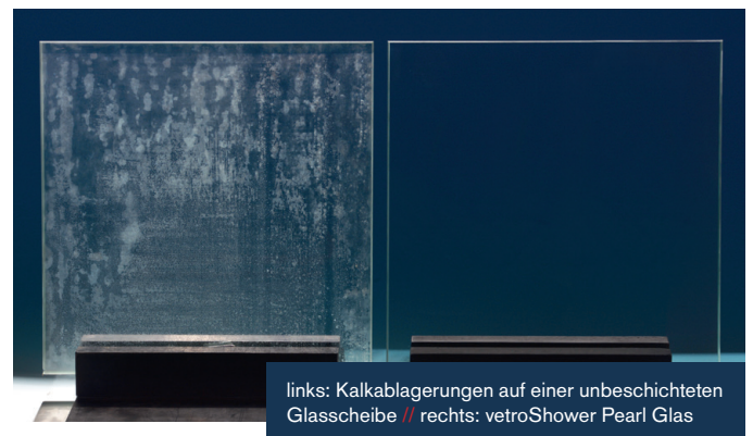
links: Kalkablagerungen auf einer unbeschichteten Glasscheibe // rechts: vetroShower Pearl Glas