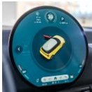
Pantalla central OLED con una superficie de 440 cm 2 .