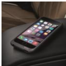
Espacio para carga inalámbrica.

• Sistema de navegación GPS MINI. • Modos de manejo MINI Driving Experience. • Control crucero con función de frenado. • Driving Assistant: Advertencia de cambio de carril, advertencia de tráfico de cruce trasero con intervención de freno, advertencia de salida, prevención de colisión trasera • Parking Assistant: Asistencia de estacionamiento, Asistente de marcha atrás, Control activo de distancia de estacionamiento, Control de distancia de aparcamiento (PDC), Cámara de asistencia de marcha atrás con vista panorámica trasera.