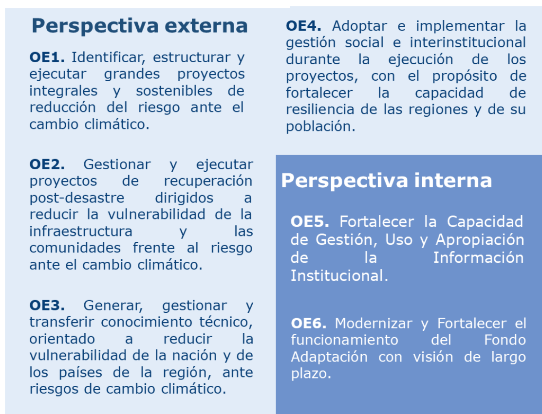
Ilustración 1. Objetivos Estratégicos por perspectiva

En el marco la perspectiva interna se articula de la siguiente manera: