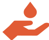
Agua y saneamiento