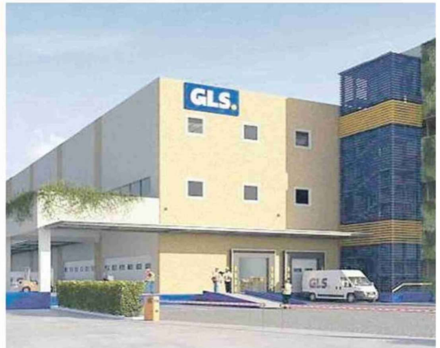
Da sinistra l'insediamento Farvima a Nola e un rendering dello stabilimento di Temi