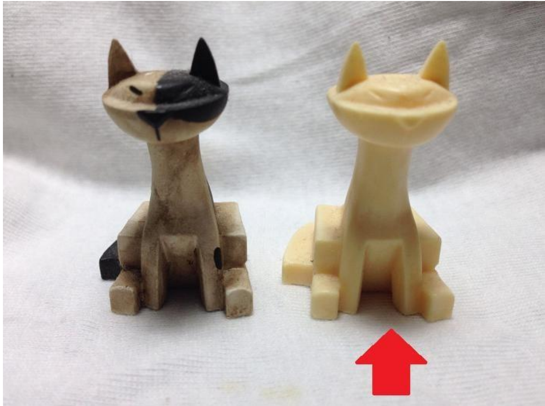
圖二、(左)正規品 / (右)賣家的商品