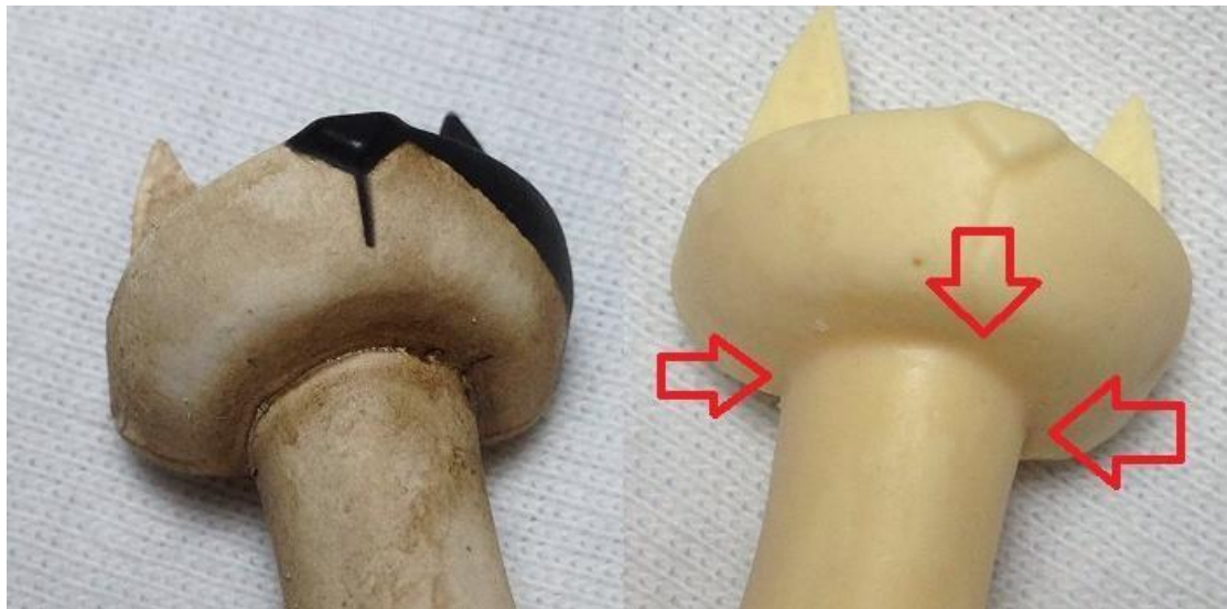
圖五、商品差異 - 脖子與頭的連接處弧度圓滑