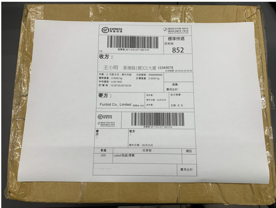
圖一、商品香港原始外箱含速遞單