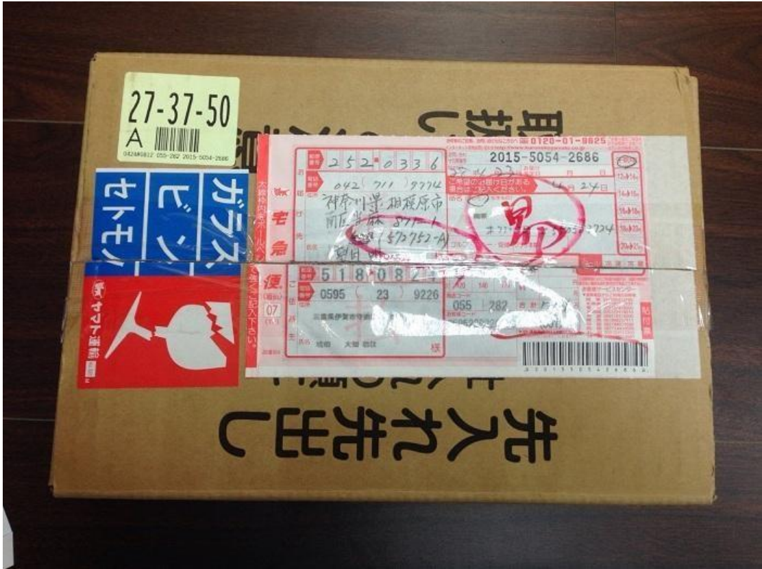
圖二、商品日本原始速遞單