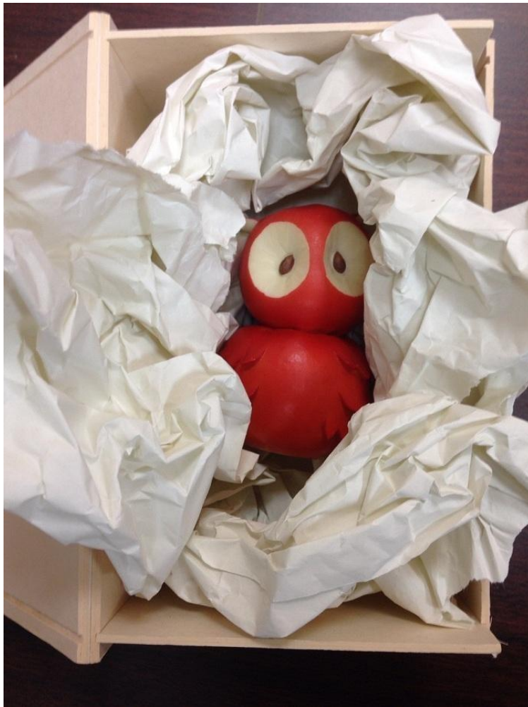
圖七、商品實際照片