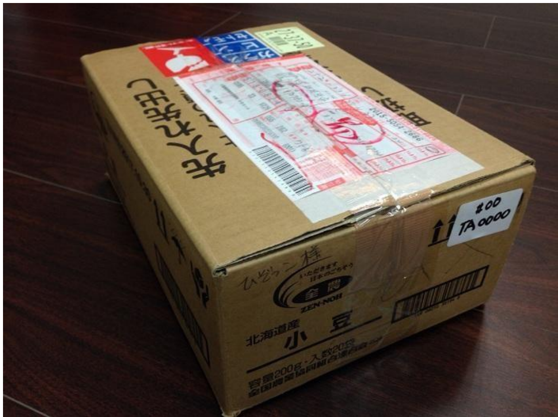
圖三、原始外箱照片-1