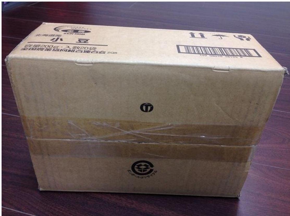
圖五、原始外箱照片-3