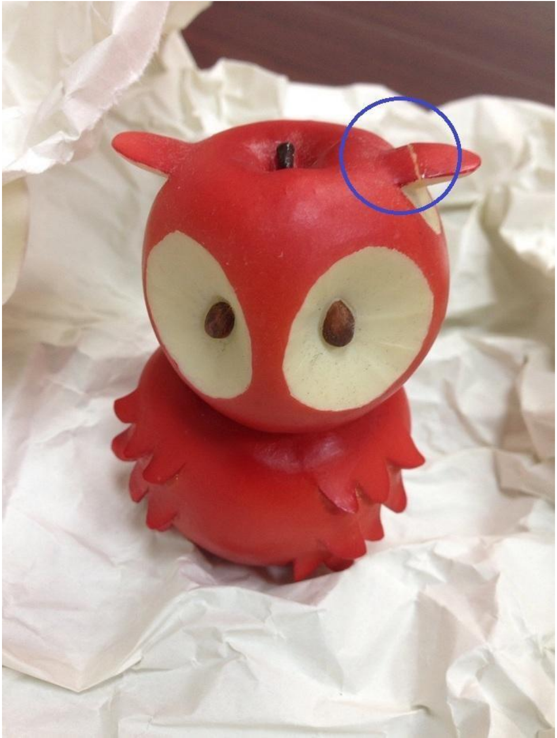
圖八、商品問題照片-1