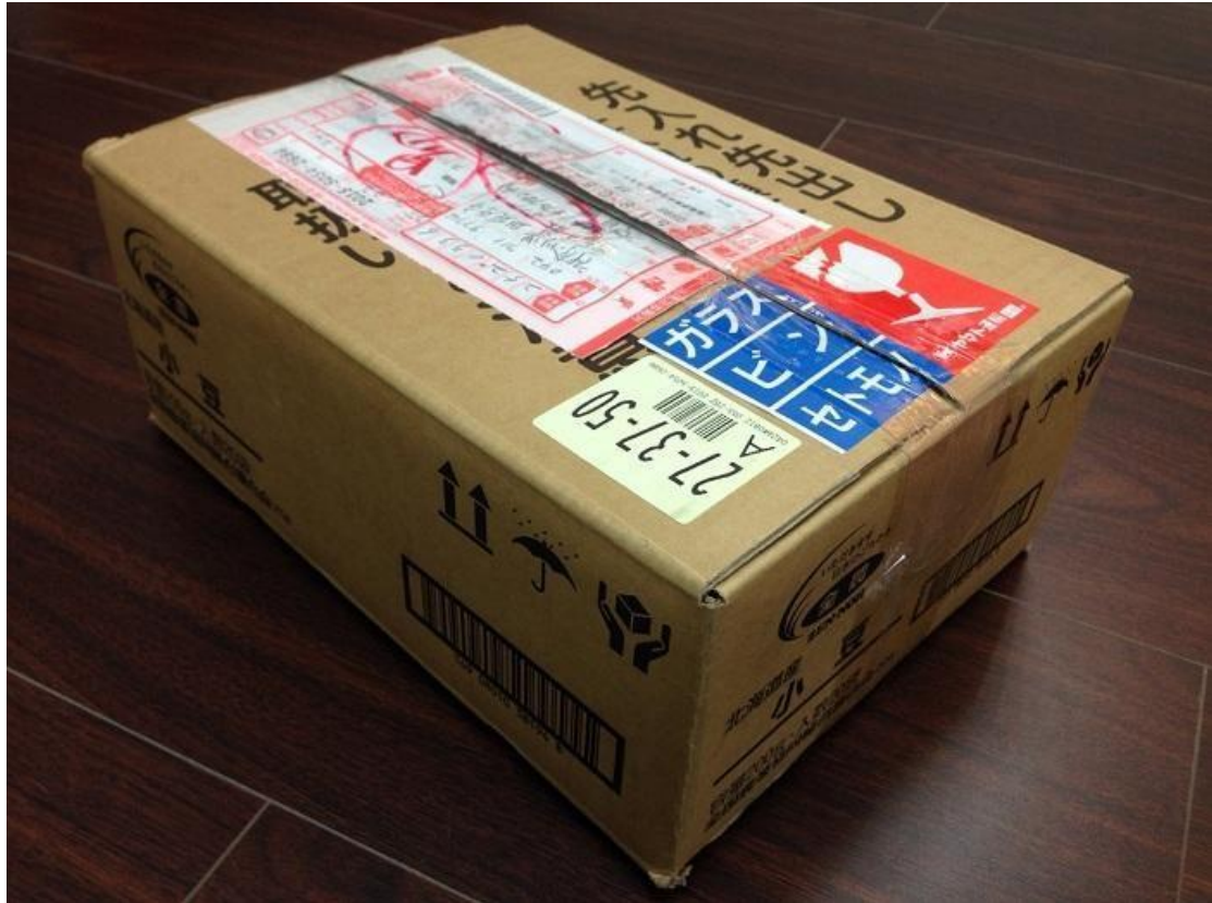
圖四、原始外箱照片-2